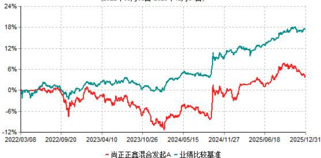
尚正正鑫混合发起A累计净值增长率与业绩比较基准收益率历史走势对比图 (2022年03月08日-2025年12月31日)