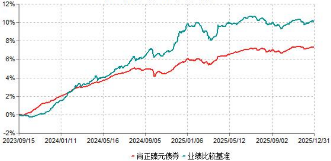
尚正臻元债券累计净值增长率与业绩比较基准收益率历史走势对比图 (2023年09月15日-2025年12月31日)